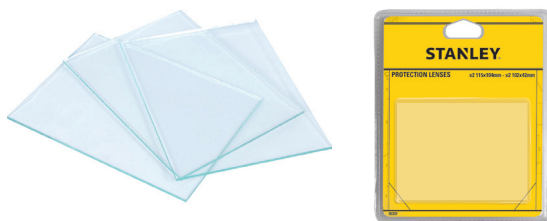
90331 SET 4-DELNI STEKEL ZA MASKO 90368

Zatemnjenost DIN 9/13 Površinski pogled: 98x43 mm. UV zaščita / R do DIN 16.