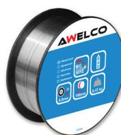
92948 ALU Ø0.8 | kg:0,45