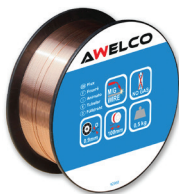
92960 FLUX Ø0.9 | kg:0.5