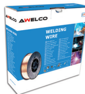
92946 ALU Ø0.8 | kg:2