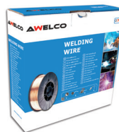
92949 ALU Ø1.0 | kg:2