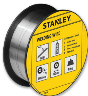
90116 INOX Ø0.8 | L:100mm | kg:1,0