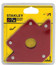
98031 Magnetno držalo