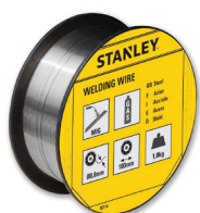
90114 SG2 Ø0.8 | L:100mm | kg:1,0