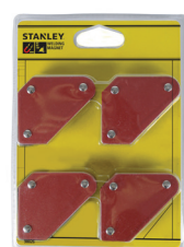
98026 Mini magnetna držala