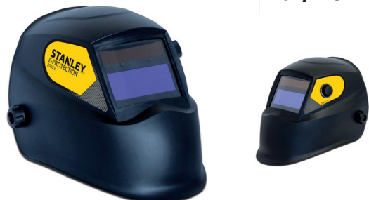
90368 ZAŠČITNA MASKA DIN 9-13